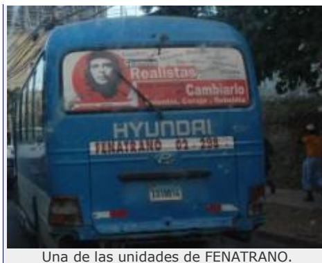
Una de las unidades de FENATRANO.